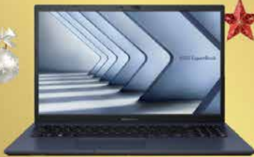
ASUS ExpertBook B1502CVA Windows 11 PRO Education

To już 25 gwiazdka od kiedy Państwo są z nami. Dziękujemy.