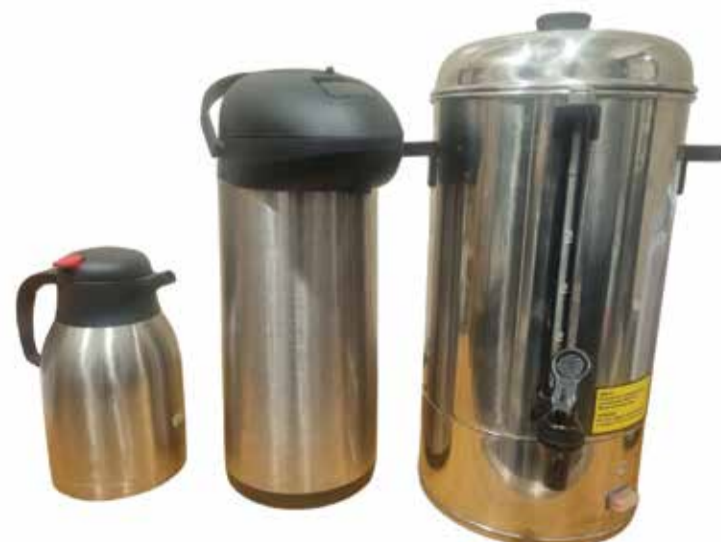
Termosy 2l i 10l, warnik Stalgast 10l 230V

...oraz inny używany sprzęt nagłaśniający i biurowy.