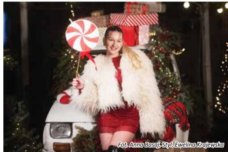
Styl. Ewelina Krajewska