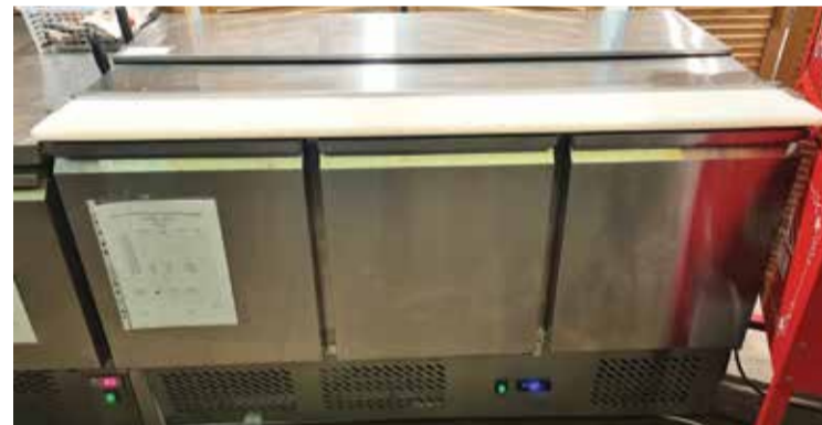
Lodówka gastronomiczna dostosowana do GN

W związku z zakończeniem działalności, kawiarnia Kulturalna sprzedaje: