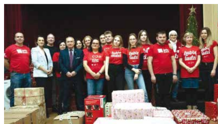
...w Pionkach