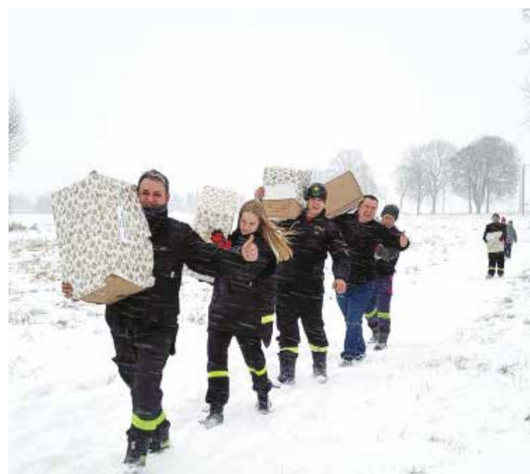
■ Czy śnieg, czy zawieja.. Szlachetnych wolontariuszy nie zraża to ani trochę!