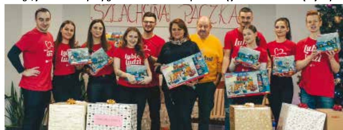
...w Garbatce Letnisko

Weekend Cudów zastał nas w Kozienicach, gdzie relacjonowaliśmy finał Szlachetnej Paczki dla tego regionu - ale przecież obszar, który pokrywa nasza dystrybucja (i zainteresowanie) jest o wiele większy! A ponieważ WSZYSTYCY, którzy zaangażowali się w tę mądrą i piękną akcję, zasługują na uhonorowanie, poniżej mały kolaż finałowych zdjęć zaczerpniętych z ich stron FB. Kłaniamy się Wam w pas - jeśli ktokolwiek jest w stanie uchwycić ducha tych świąt takiego, jakim chcielibyśmy go zawsze widzieć - z pewnością jesteście to WY. Dziękujemy!