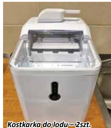
Kostkarka do lodu - 2szt.