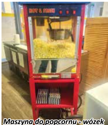
Maszyna do popcornu - wózek