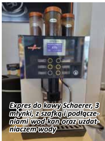
Expres do kawy Schaefer, 3 młynki, z szafką i podłączeniami wod-kan oraz uzdatniaczem wody