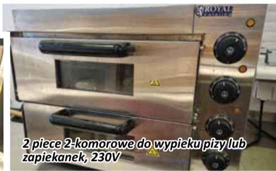
2 piece 2-komorowe do wypieku pizzy lub zapiekanek, 230V