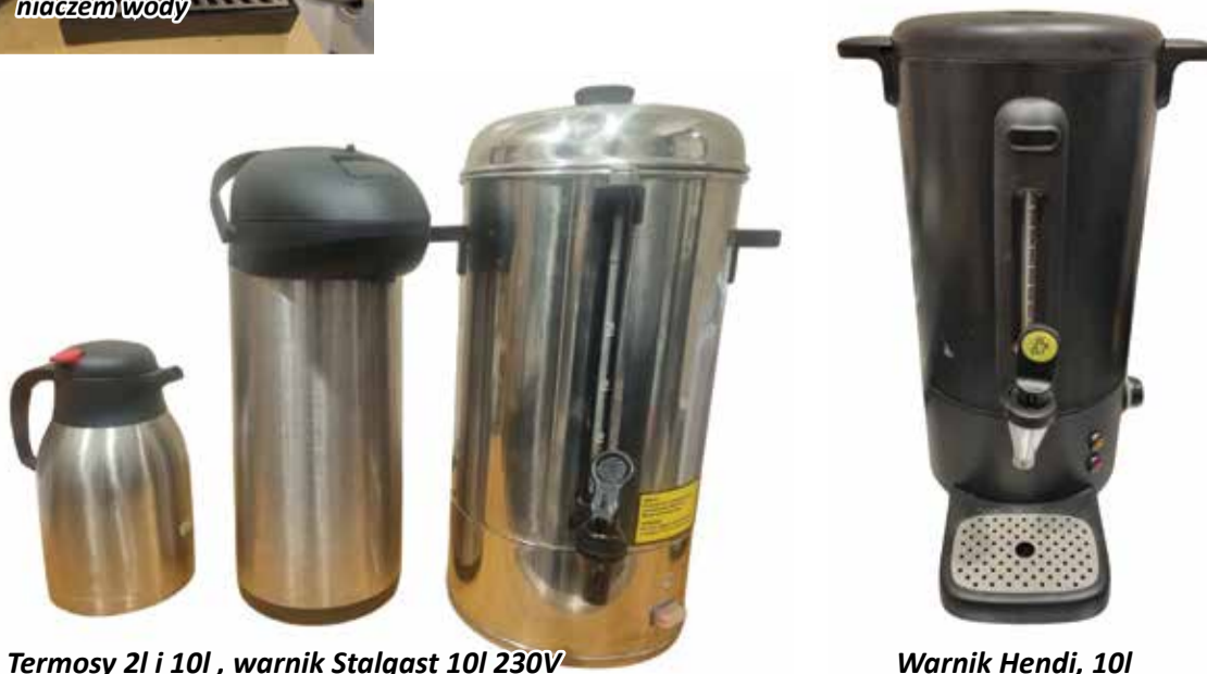
Termosy 2l i 10l, warnik Stalgast 10l 230V