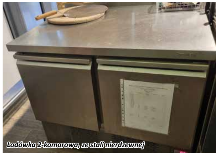
Lodówka 2-komorowa, ze stali nierdzewnej