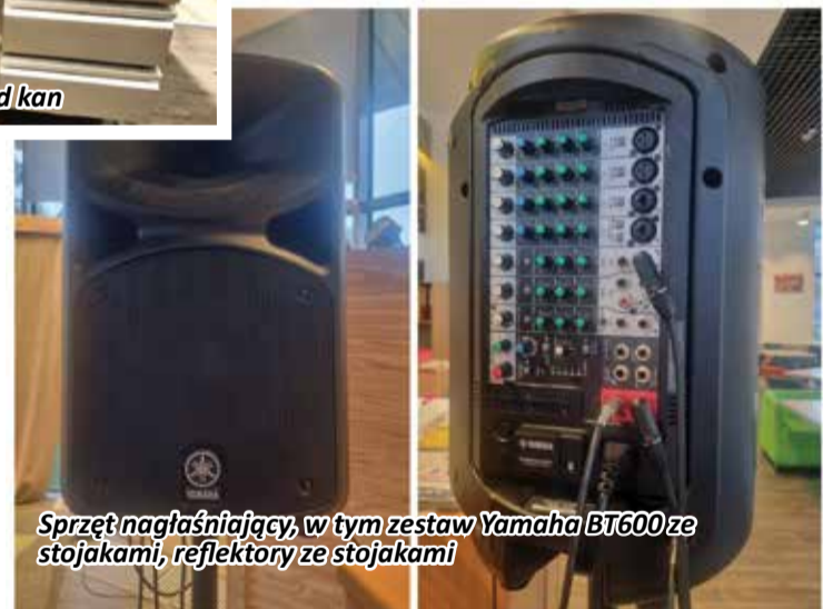
Sprzęt nagłaśniający, w tym zestaw Yamaha BT600 ze stojakami, reflektory ze stojakami