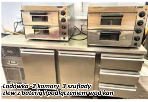
Lodówka -2 komory 3 szuflady zlew z baterią i podłączeniem wod-kan