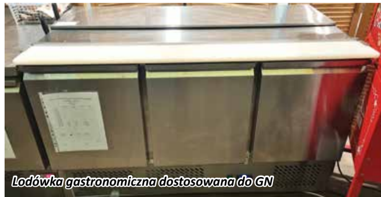
Lodówka gastronomiczna dostosowana do GN