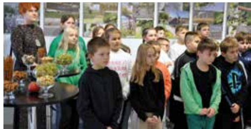
■ W wernisażu uczestniczyli między innymi uczniowie Szkoły Podstawowej w Zwoleniu.