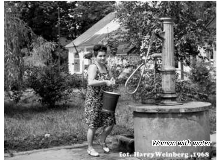
Woman with water

mowa), „Sleeping Town in Poland – Flirting with a girl” (Senne miasteczko w Polsce - flirtując z dziewczyną), „Worlds collision” (Zderzenie światów) czy „Conversation between two gentlemen” (Rozmowa dwóch dżentelmenów). Znaleźć je można na stronie Exibart Street (www.exibartstreet.com/harry-