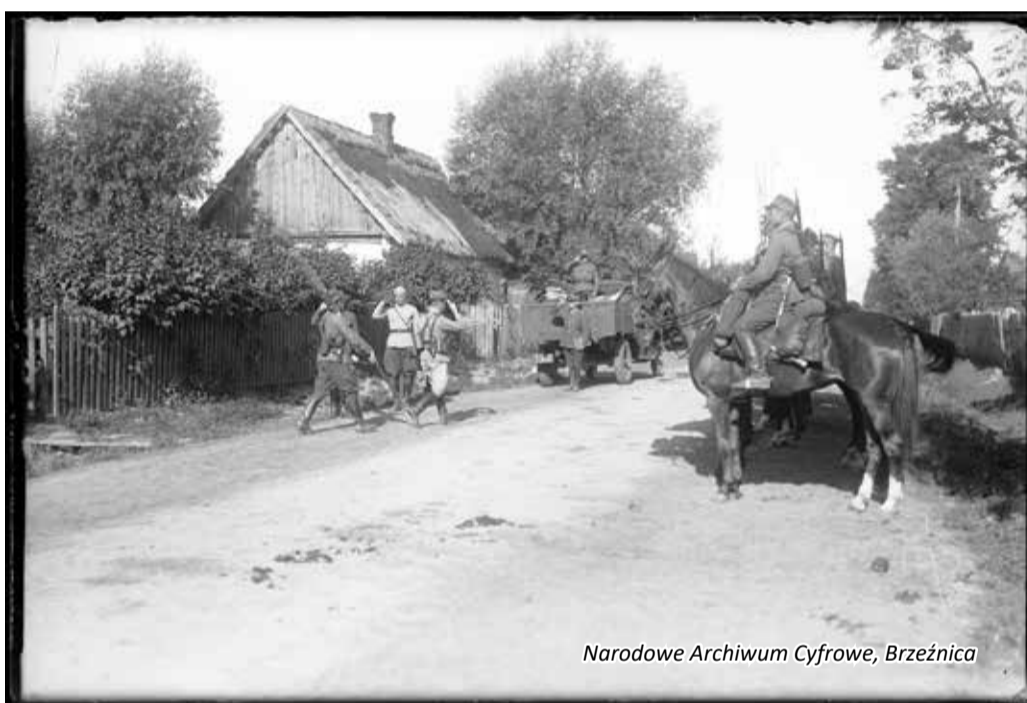
Narodowe Archiwum Cyfrowe, Brzeźnica

W trakcie manewrów pułk był również w Brzeźnie. Na fotografiach widzimy pojenie koni żołnierskich w folwarku. Jego właściciele Heydlowie ugościli też posiłkiem kadrę dowódczą. Jedno z zdjęć ukazuje rodzinę