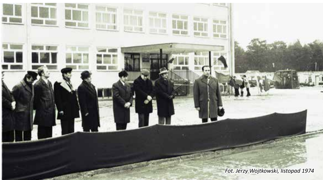
Fot. Jerzy Wojtkowski, listopad 1974

Nadchodzący jubileusz pragniemy spędzić wśród naszych wychowanków, ich rodziców, pracowników, osób zaprzyjaźnionych. W związku z tym zapraszamy na obchody 50-lecia szkoły, które odbędą się 11 października 2024r. Program uroczystości dostępny jest na stronie szkoły; www.zslp.edu.pl . Wszelkich informacji udziela kancelaria placówki.