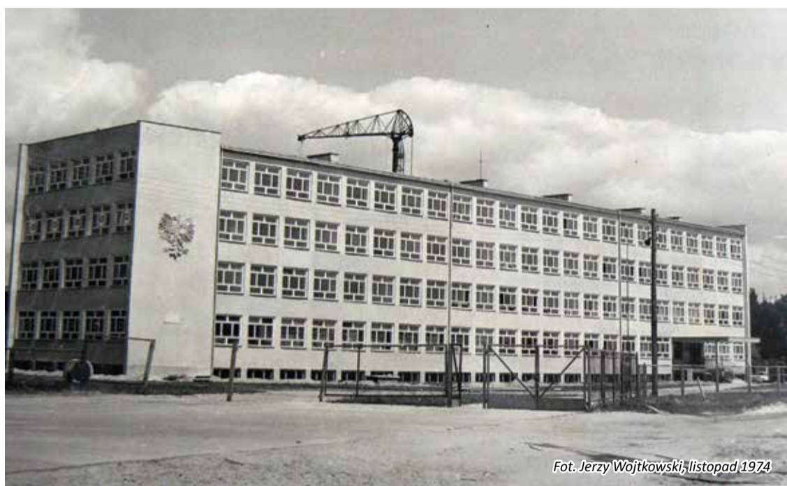
Fot. Jerzy Wojtkowski, listopad 1974