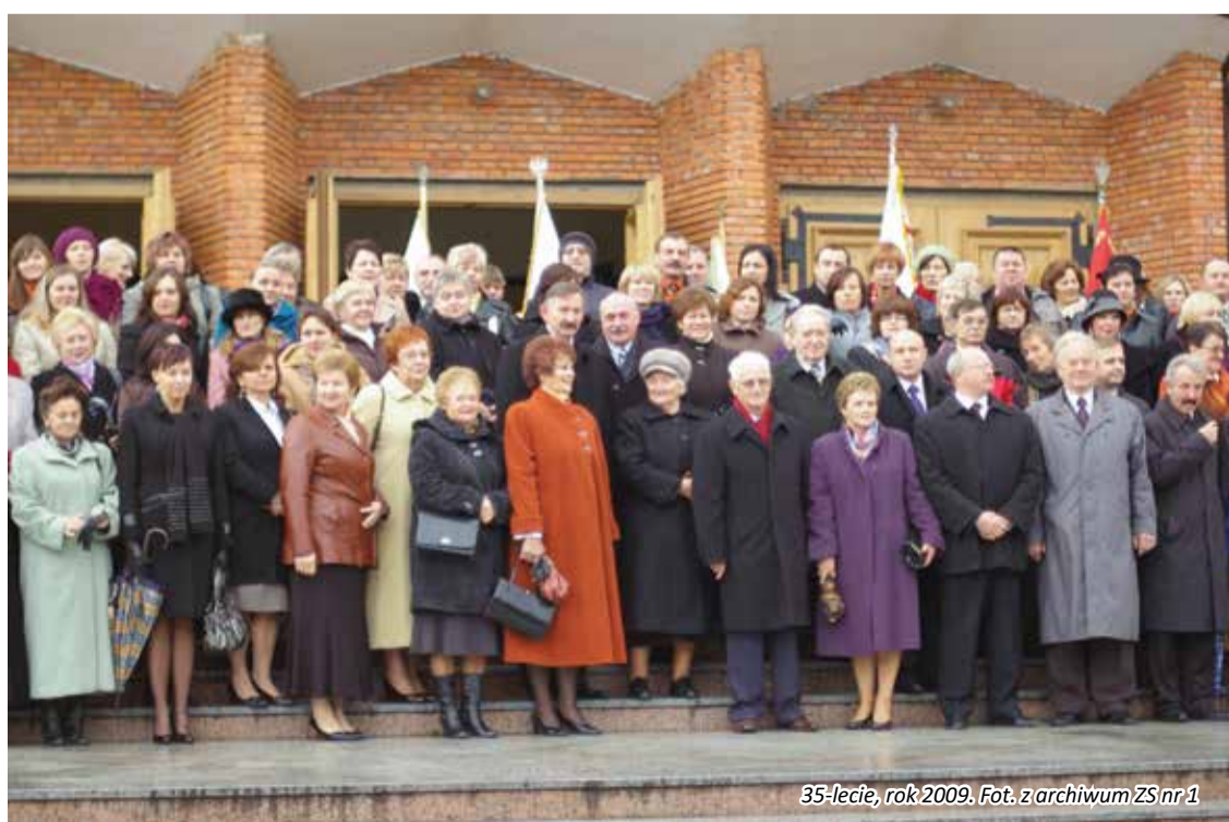
35-lecie, rok 2009.