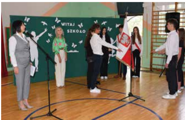
Liceum Ogólnokształcące w Kozienicach