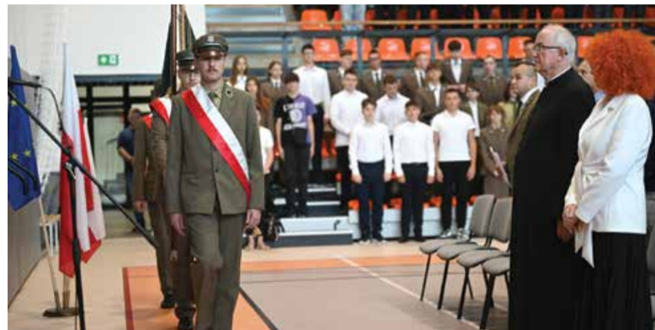
Zespół Szkół Drzewnych i Leśnych w Garbatce-Letnisku