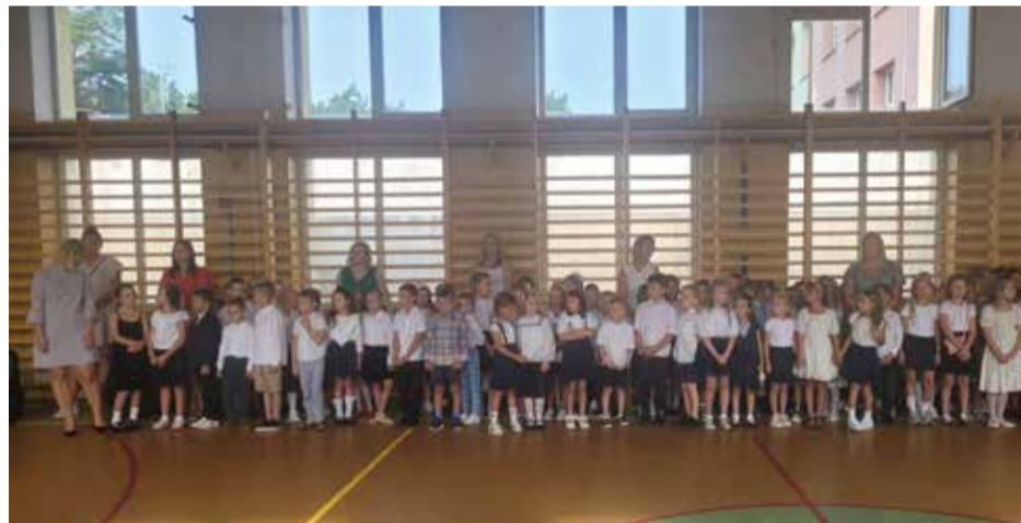
Publiczna Szkoła Podstawowa Nr. 2 im. Króla Zygmunta Starego w Kozienicach

Jak co roku we wrześniu, choć tym razem dzień później niż zazwyczaj, uczniowie szkół naszego regionu powrócili do swoich ławek, kolegów, koleżanek i nauczycieli. Dołączyli do nich, rzecz jasna, najmłodszy uczniowie, czyli ci, którzy do szkoły nie wracają, bo w jej progi zawitali po raz pierwszy. Wszystkim Wam życzymy samych najlepszych ocen, wspaniałego czasu spędzonego z rówieśnikami i jak najmniej stresu przed klasówkami!