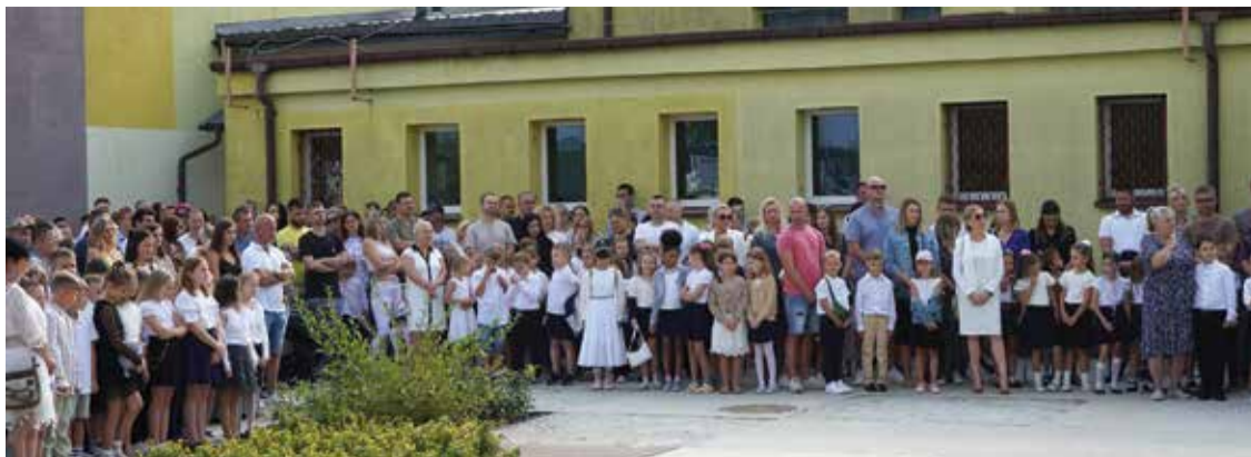
Publiczna Szkoła Podstawowa nr 1 z Oddziałami Integracyjnymi w Kozienicach