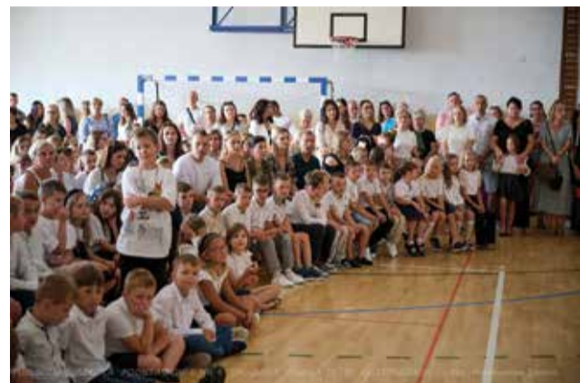
Publiczna Szkoła Podstawowa nr 4 w Kozienicach