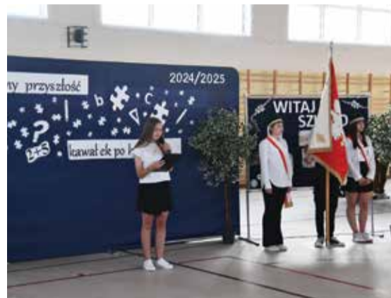
Publiczna Szkoła Podstawowa im. Królowej Jadwigi w Garbatce-Letnisku