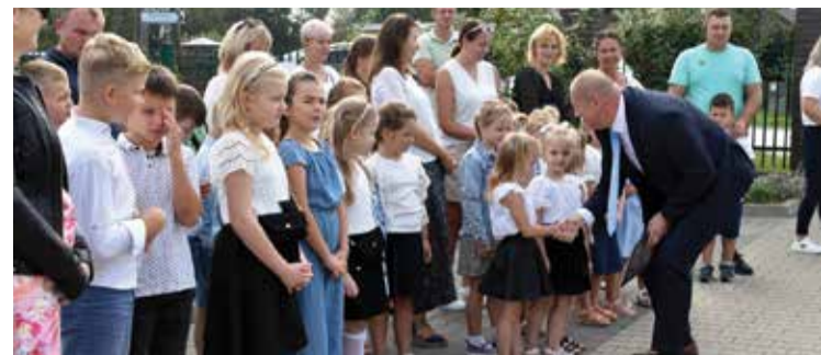
Publiczna Szkoła Podstawowa w Wólce Tyrzyńskiej