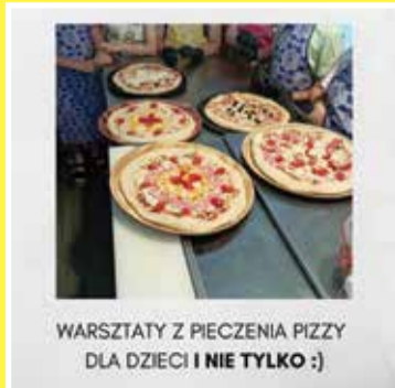
WARSZTATY Z PIECZENIA PIZZY DLA DZIECI I NIE TYLKO :)