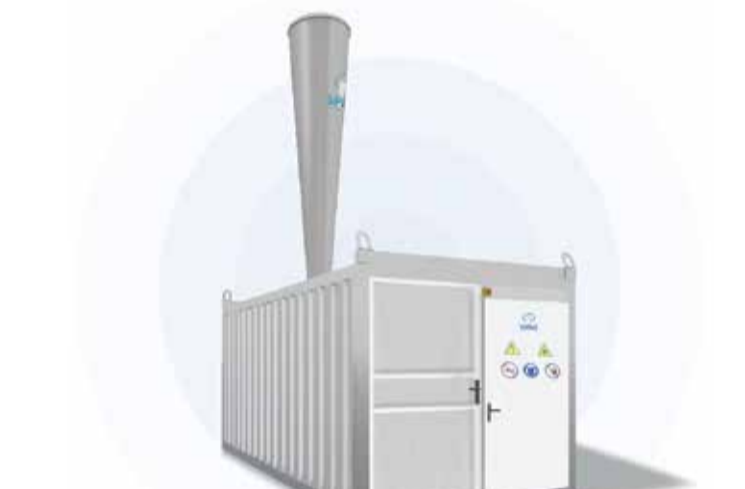
■ Współczesne dział przeciwgradowe, prezentacja na stronie producenta

nego z tym uciążliwego huku, pod drugie zaś braku opadów deszczu. Oni także nie mogą podbudować swoich stwierdzeń naukowo, dzielą się jednak tym, co widzą na własne oczy — a widzą coś, co opisują w następujący sposób: „Wygląda to, jakby chmura najpierw była rozdzielana na pół, a następnie odgarniana. Widzimy, jak się od nas odsuwa. Możliwe, że ten deszcz rzeczywiście z niej potem spada... tyle że nie u nas”. Konsekwencją ma być lokalna susza ze wszystkimi jej konsekwencjami, w tym koniecznością dodatkowego, kosztownego nawadniania upraw i ogrodów.