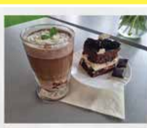
FENOMENALNA RZEMIEŚNICZA KAWA Z KAZIMIERZA