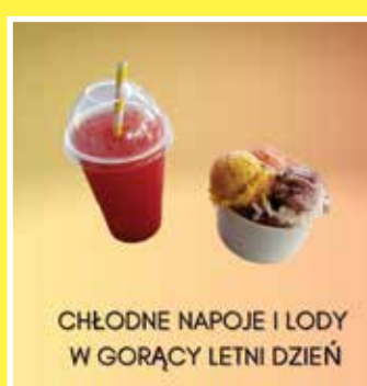
CHŁODNE NAPOJE I LODY W GORĄCY LETNI DZIEŃ