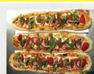
ZAPIEKANKI WŁOSKIE I KLASYCZNE