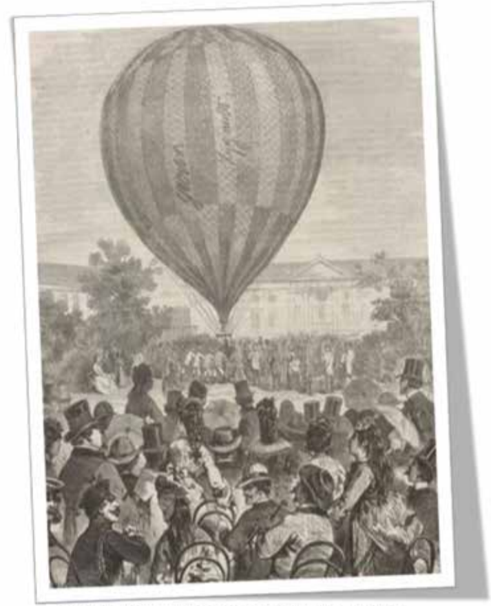
Start balonu Warszawa 1873 rok wg ryciny czasopisma Włościanin