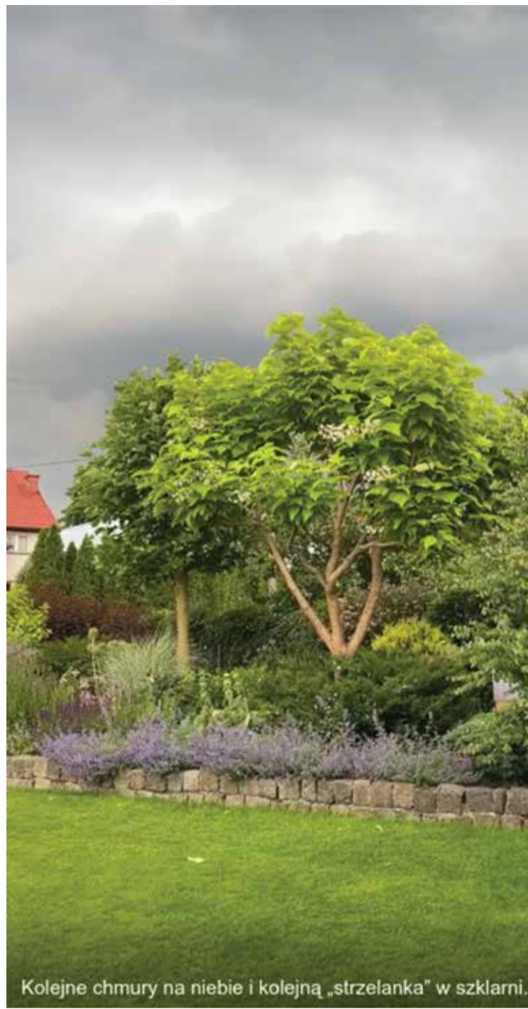
Kolejne chmury na niebie i kolejną „strzelanką” w szklarni.

Sumując: miało być super, z czasem entuzjazm opadł. Mieszkańcy najwyraźniej nie tylko nie zyskali na inwestycji jako społeczność, ale muszą też borykać się z dodatkowymi uciążliwościami. Czy pomogą interpelacje i urzędowe interwencje? Czas pokaże. My z pewnością prześlemy ten artykuł do wiadomości przedsiębiorstwa, licząc, że w kolejnym wydaniu będziemy mogli zaprezentować Państwu jego stanowisko.