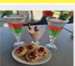
NAJLEPSZE CIASTA FANTAZYJNE DESERY