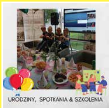
URÓDZINY, SPOTKANIA & SZKOLENIA