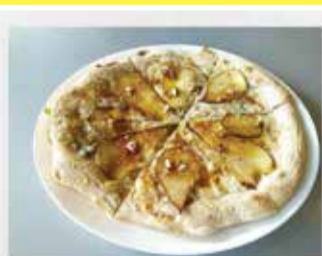
PIZZA (W TYM NASZ SPECJAŁ: Z SEREM PLEŚNIOWYM I GRUSZKĄ)