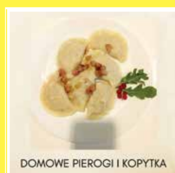
DOMOWE PIEROGI I KOPYTKA