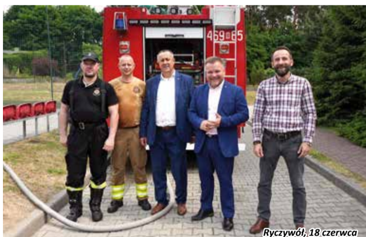
Ryczywół, 18 czerwca