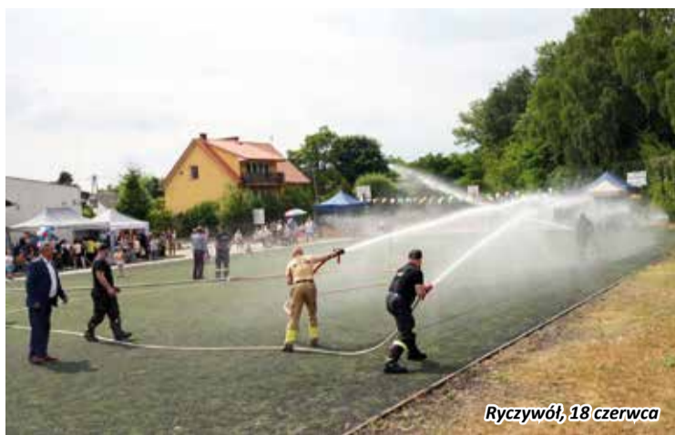
Ryczywół, 18 czerwca