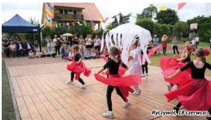
Ryczywół, 18 czerwca