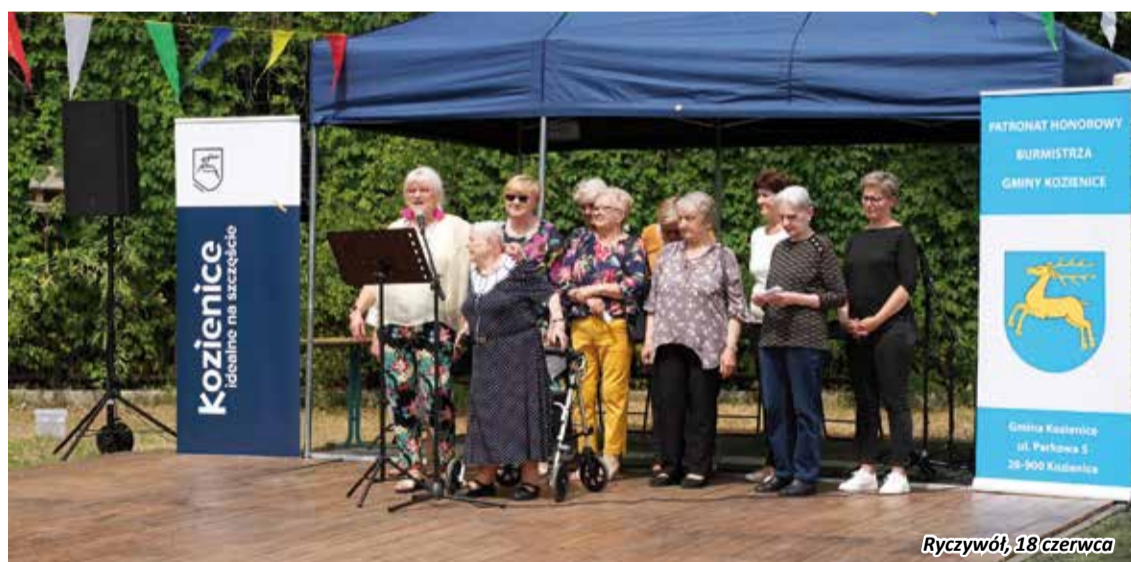
Ryczywół, 18 czerwca