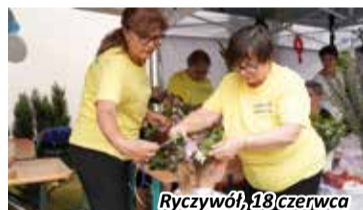
Ryczywół, 18 czerwca