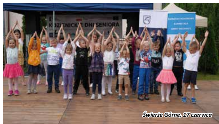
Świerże Górne, 17 czerwca