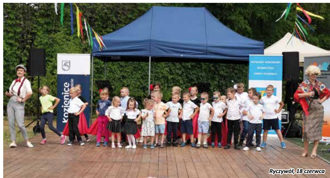
Ryczywół, 18 czerwca