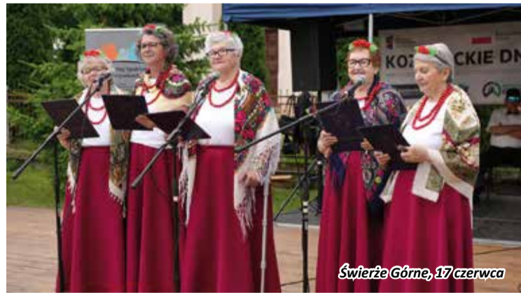
Świerże Górne, 17 czerwca