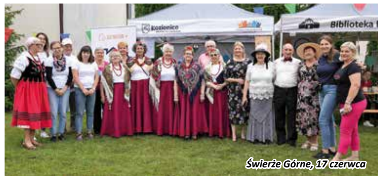
Świerże Górne, 17 czerwca