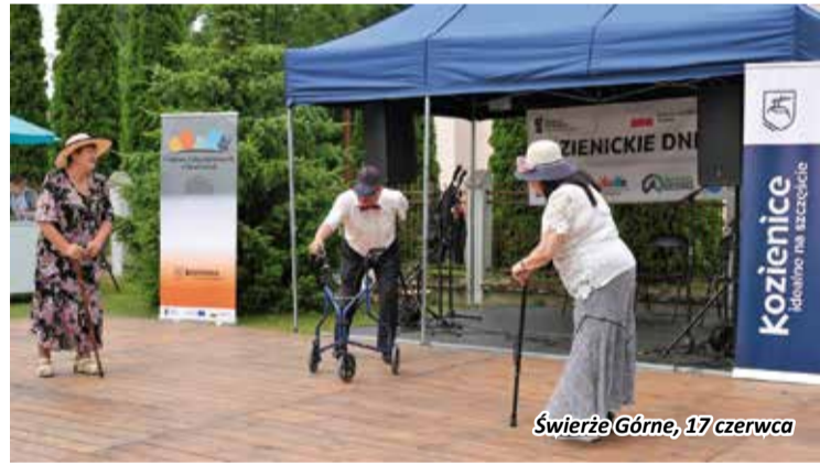
Świerże Górne, 17 czerwca