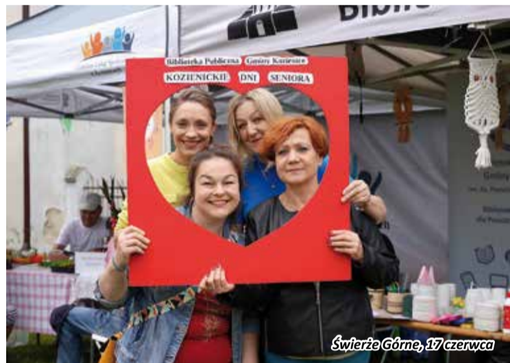
Świerże Górne, 17 czerwca