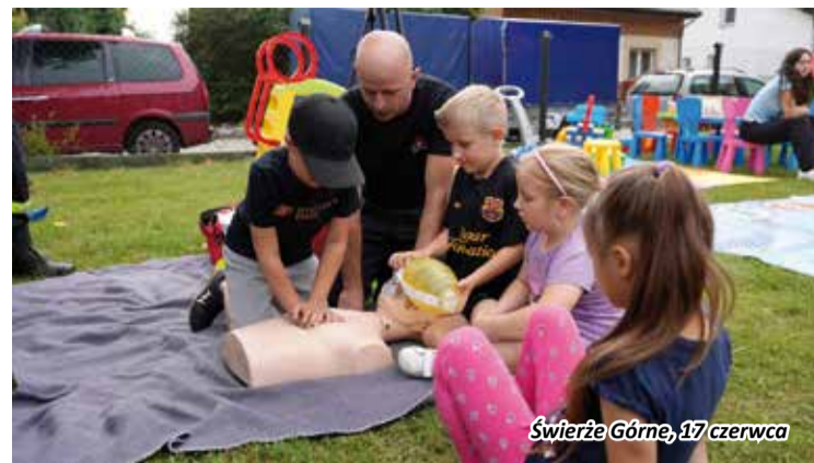
Świerże Górne, 17 czerwca