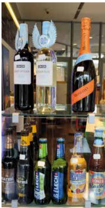
Jak trunki to tylko i wyłącznie bezalkoholowe!

A jeśli ktoś nie ma akurat czasu by usiąść i wpada jedynie na kilka minut, by zgrnąć coś na szybko, zapiekanka klasyczna (obok wciąż dostępnych - jedynie u nas! - zapiekank włoskich) zawsze będzie na miejscu!