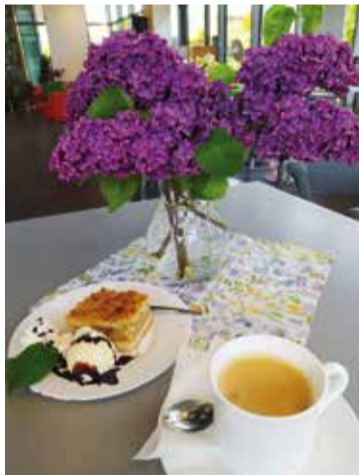
...na deser zaś nie potrafimy chyba wyobrazić sobie nic lepszego, niż SZARLOTKA NA CIEPŁO Z LODAMI!