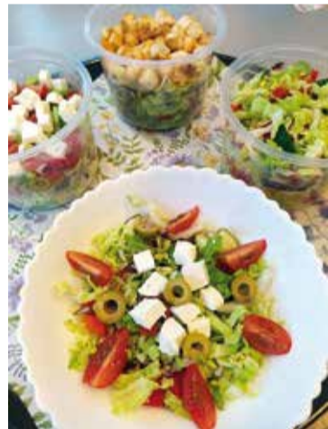
W sekcji dań lekkich polecamy także nasze sałatki...