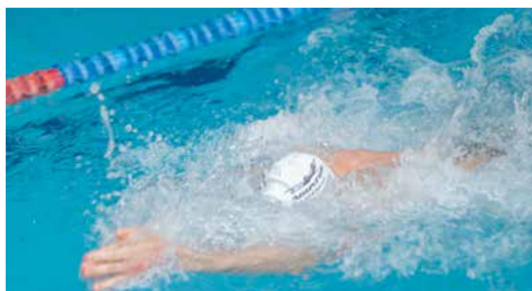
■ Najlepszy zawodnik Kozenice Sprint CUP 2025 - Tomasz Luśtyk.