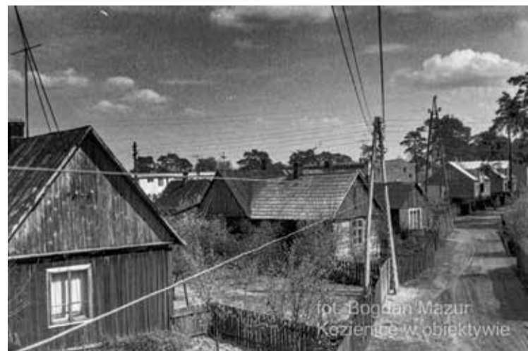
Kozienice w obiektywie