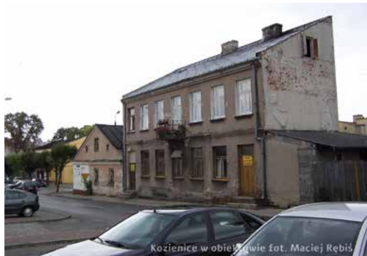
Kozienice w obiektywie