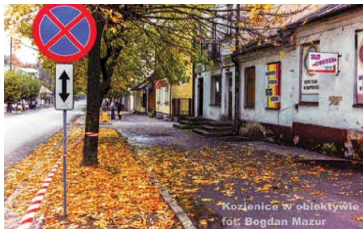
Kozienice w obiektywie