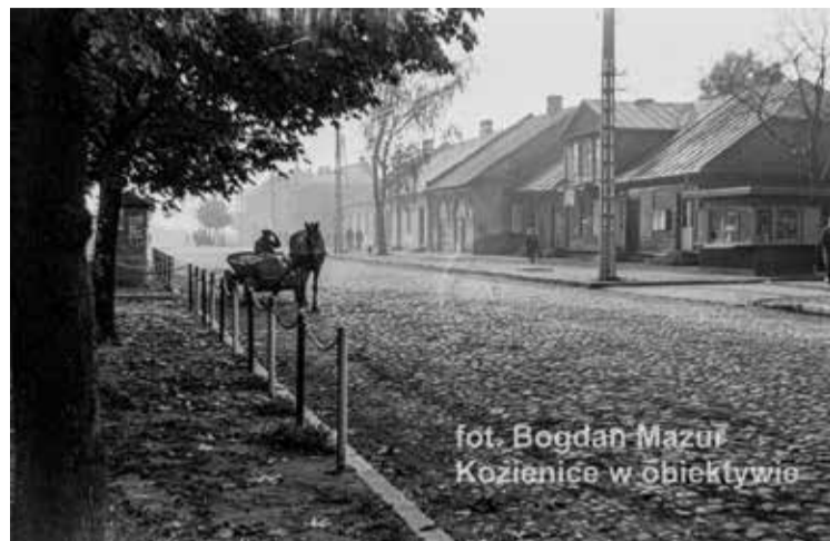
fot. Bogdan Mazur Kozienice w obiektywie

Jak Pan patrzy jako fotograf z doświadczeniem i taki powiedzmy „tradycyjny” na to, jak fotografia wygląda teraz, gdy w zasadzie każdy nosi w kieszeni urządzenie pozwalające na robienie zdjęć i gdy tych zdjęć codziennie wykonuje się