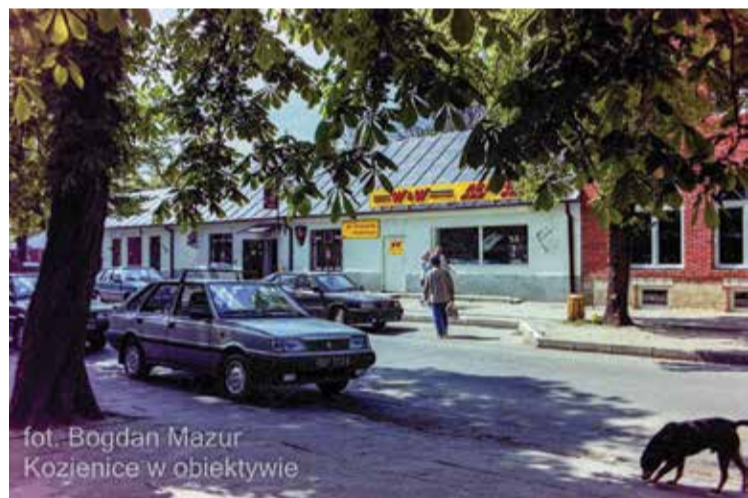
fot. Bogdan Mazur Kozienice w obiektywie