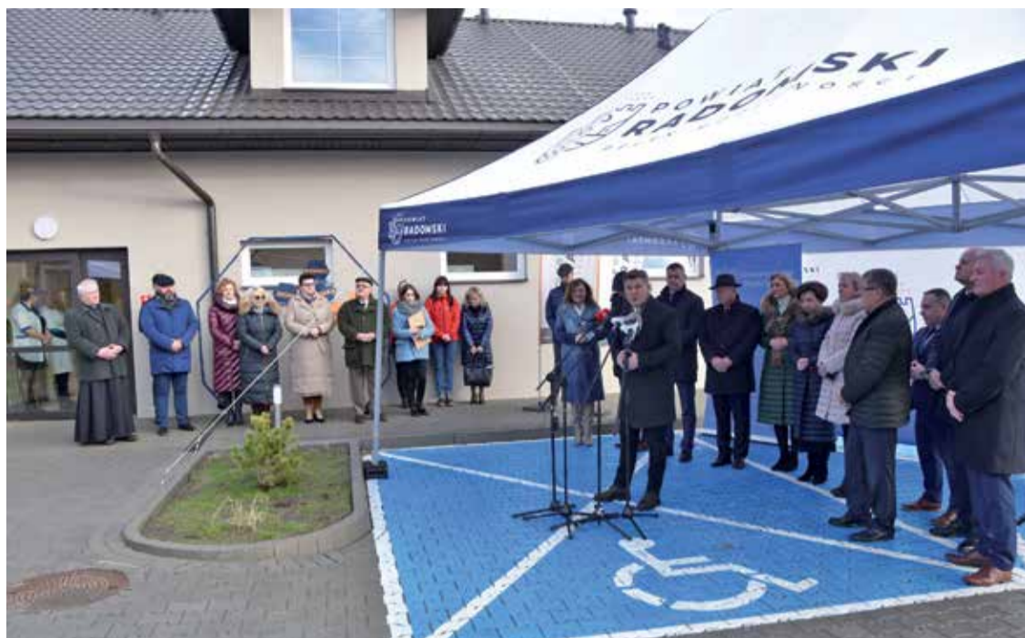
■ Od stycznia 2023 roku w Krzyżanowicach działa Powiatowe Centrum Opiekuńczo – Mieszkalne dla chorych i seniorów.

Wielkie zmiany zaszły w Specjalnym Ośrodku Szkolno – Wychowawczym, czyli dawnej szkole rolniczej w Chwałowicach. Zakończyła się tam budowa krytego amfiteatru, miniobserwatorium astronomicznego oraz łącznika pomiędzy szkołą a internatem. Wcześniej w starym