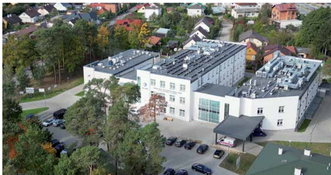
■ Ponad 100 milionów złotych przeznaczono na budowę nowego szpitala powiatowego w Pionkach. Władze powiatu spełniły marzenie wielu pokoleń mieszkańców.

budynku powstała jedna z najnowocześniejszych w regionie placówek dla uczniów ze specjalnymi potrzebami edukacyjnymi.