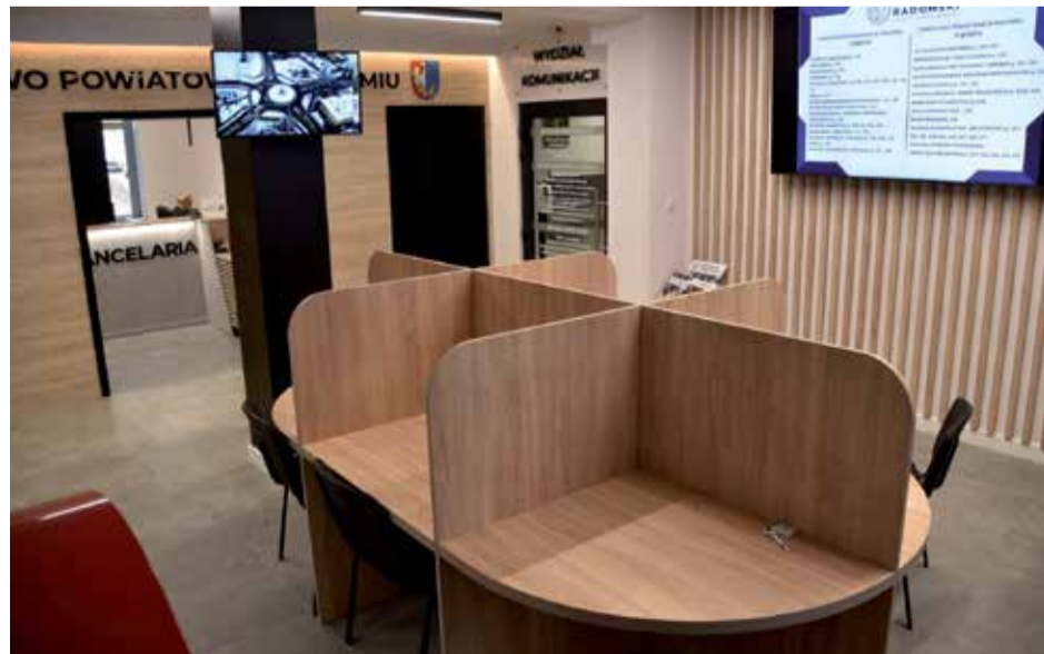
■ Wyremontowano pomieszczenia w Starostwie Powiatowym dzięki czemu poprawiły się warunki przyjmowania klientów.