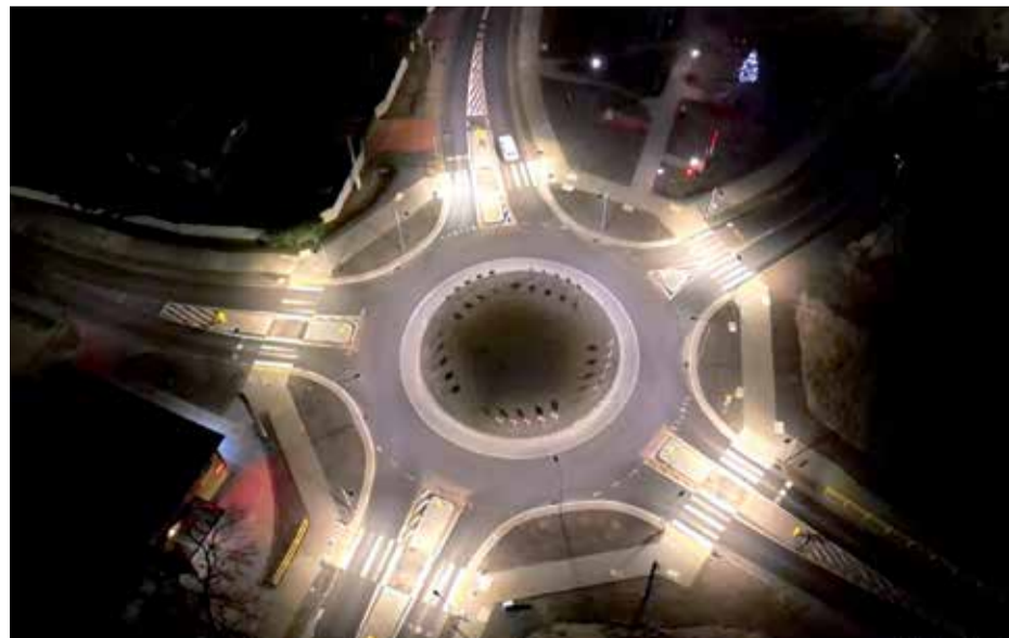
■ Skrzyżowanie w Kowali doczekało się przebudowy. Teraz jest tam bezpieczne i szerokie rondo.

Najważniejszą była budowa Powiatowego Centrum Opiekuńczo – Mieszkalnego w Krzyżanowicach koło Iłży. Jest to pierwsza tego typu jednostka w Powiecie Radomskim, przeznaczona dla osób ze znacznym oraz umiarkowanym stopniem niepełnosprawności. Przebywa w niej 23 osoby, z czego 15 jest tam dowożonych na zajęcia i terapię, a jedynie 8 podopiecznych mieszka tam na określony czas. Koszt budowy i wyposażenia PCOM wyniósł 4,4 miliona złotych.