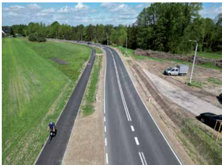
■ W ostatnich latach w Powiecie Radomskim przebudowano blisko 250 kilometrów dróg.